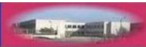
PLESSO DON LAURI