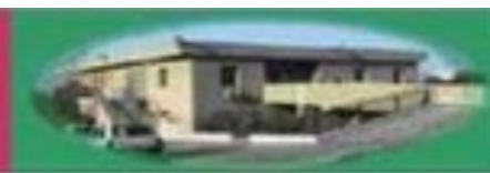
PORTELLA DI MARE